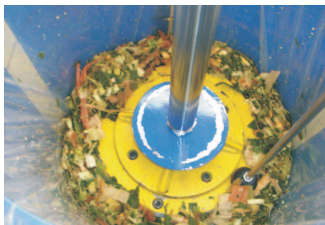
Rys. 3. Cylinder zagęszczający w czasie prasowania materiału roślinnego za pomocą tarczy dociskowej Fig. 3. Compacting cylinder during plant material pressing by pressing disc

Cylinder zagęszczający stanowi rura o średnicy wewnętrznej 280 mm i wysokości 430 mm (rys. 3).