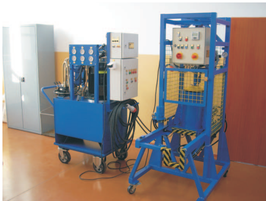
Fig. 1. Apparatus for plant material compacting with AG 5089 driving attachment

Rys. 1. Urządzenie do zagęszczania materiału roślinnego wraz z przystawką napędową AG 5089