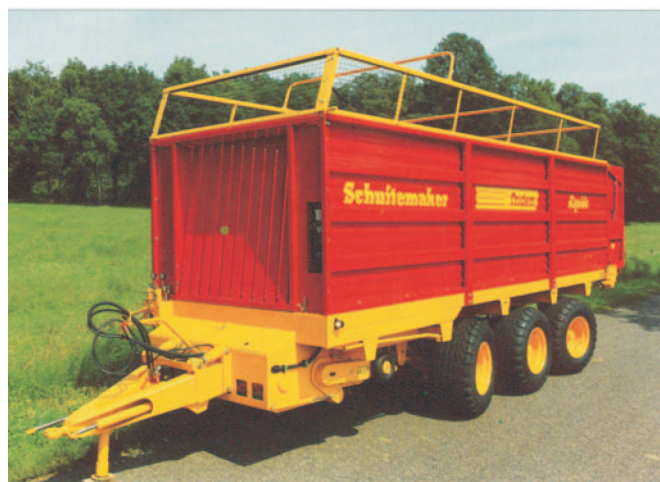
Rys. 5. Przyczepa podwójnego przeznaczenia z uniesionym podbieraczem (firma Schuitemaker Machines B.V.) Fig. 5. Dual use trailer with lifted pick-up (company Schuitemaker Machines B.V.)

rys. 5 [12]. Maszyny Rapide 100 i Rapide 135 mogą być wyposażane w walce dozujące i przenośnik poprzeczny. Najnowsza oferta wymienionego producenta odnosi się do przyczep zbierających, które zostały wyposażone w skrzynie ładunkowe dużej pojemności (Rapide 2085 42 m 3 i Rapide 3000 57 m 3 ). Wymienione maszyny mogą być wyposażane w walce dozujące. Przyczepy zbierające produkowane przez firmę Schuitemaker Machines B.V. mogą być łatwo przystosowane do przewozu pasz zbieranych siewczarniami zbierającymi ze względu na podbieracz typu pchanego.