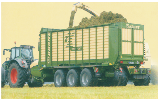
Rys. 4. Przyczepa podwójnego przeznaczenia firmy Krone Fig. 4. Dual use trailer of Krone company

W ofercie czołowych producentów przyczep zbierających (np. Krone, Schuitemaker Machines B.V., VMR Veenhuis Machines B.V.) są również maszyny co najmniej podwójnego przeznaczenia, rys. 3. Przykładem mogą być przyczepy z serii ZX, które są przystosowane do zbioru pasz oraz mogą stanowić przyczepę objętościową w technologii z zastosowaniem siewczarni samojezdnych (tab. 1). W odróżnieniu od zwykłych przyczep zbierających produkowanych przez firmę Krone różnią się przede wszystkim kształtem skrzyni ładunkowej i brakiem siatki zabezpieczającej (rys. 4).