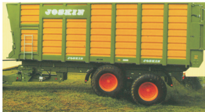
Rys. 2. Przyczepa objętościowa SILOSPACE z zawieszeniem typu wózek jezdny ROLL-OVER ®