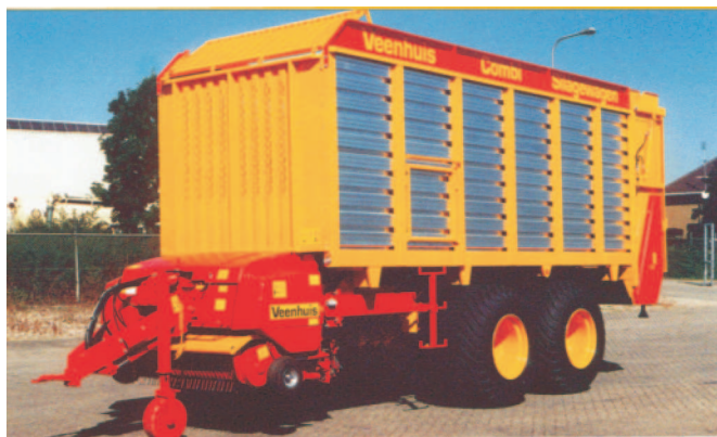
Rys. 3. Ogólny widok przyczepy zbierającej Combi wyposażonej w podbieracz zdejmowany