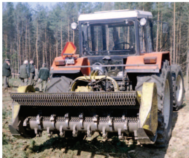
Rys. 2. Rozdrabniacz Seppi midiforst i ciągnik Ursus ZTS 16245 Fig. 2. Seppi midiforst shredder and Ursus ZTS 16245 tractor

Celem pracy było określenie wydajności pracy rozdrabniacza leśnego w wyniku doboru określonych rozwiązań organizacyjnych. Badania przeprowadzono na dwóch zestawach maszyn; rozdrabniacz Seppi midiforst sprzężony z ciągnikiem Ursus ZTS 16245 (rys. 2) oraz Atila st 1.4 z ciągnikiem Crystal 160 (rys. 3). Podstawowe dane techniczne zestawów zamieszczono w tab. 1.