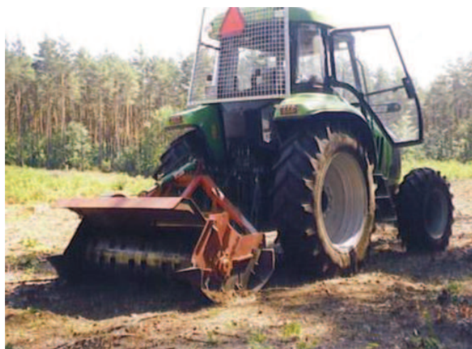
Rys. 3. Rozdrabniacz Atila 1.4 st i ciągnik Crystal 160 Fig. 3. Atila 1.4 st shredder and Crystal 160 tractor