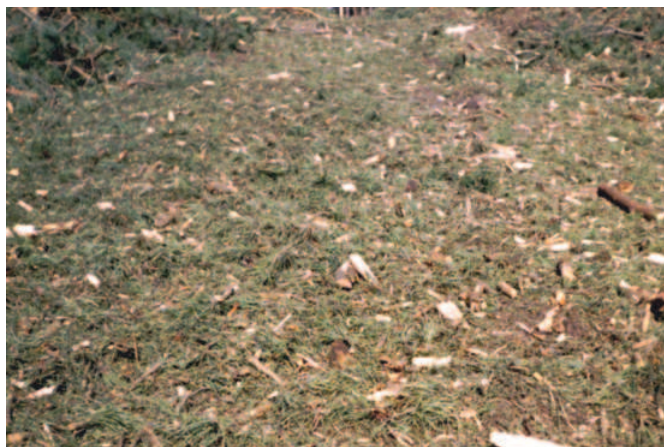
Rys. 1. Powierzchnia zrębowa po wykonaniu pracy przez rozdrabniacz leśny Fig. 1. Felling site surface after the work of forest shredder

Zasadniczym celem zagospodarowania odpadów pozrębowych poprzez uprzętnienie powierzchni leśnej, polegające na usunięciu lub rozdrobnieniu resztek powstałych podczas procesu pozyskania drewna jest przygotowanie powierzchni pod odnowienie (rys. 1). W warunkach polskiego leśnictwa najczęściej stosowaną metodą zagospodarowania powierzchni pozrębowych jest rozdrobnienie biomasy za pomocą rozdrabniacza leśnego sprzężonego z ciągnikiem rolniczym. Uzyskaną w ten sposób rozdrobnioną masę pozostawiamy na powierzchni celem wzbogacenia naturalnego siedliska leśnego. W Polsce doświadczenia w tym zakresie były już prowadzone kilkanaście lat temu, jednakże na szeroką skalę zostały rozpowszechnione dopiero w drugiej połowie lat 90.