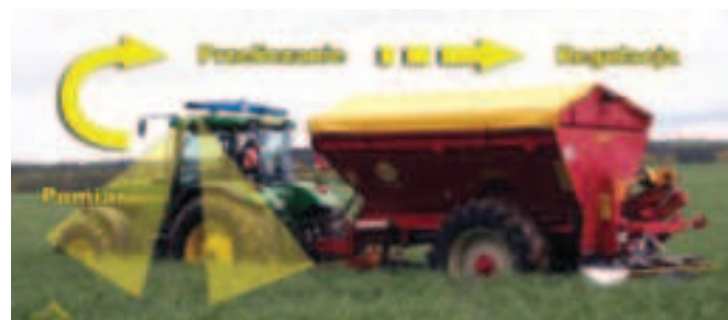
Rys. 8. Zasada działania urządzenia do optymalizacji dawki nawożenia azotowego w czasie rzeczywistym Yara N-Sensor ALS