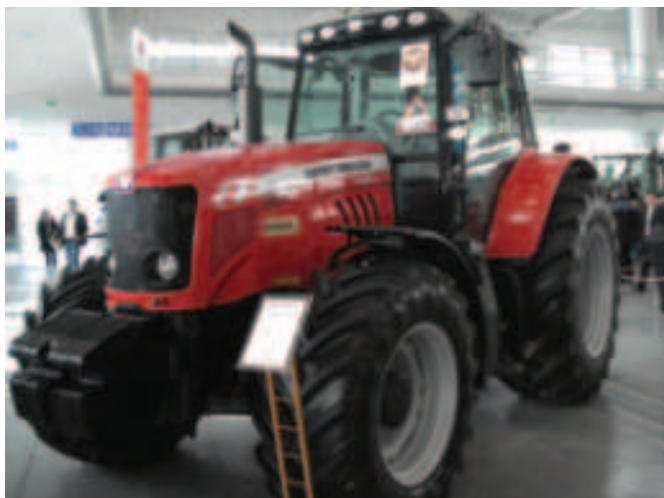
Rys. 10. Ciągnik rolniczy MASSEY FERGUSON 7480 prod. AGCO LIMITED, Wielka Brytania Fig. 10. MASSEY FERGUSON 7480 agricultural tractor manufactured by AGCO LIMITED (United Kingdom)

jest więc skrzynia z biegami pełzającymi. Prędkość maksymalną 40 km/h ciągnik rozwija już przy 1700 obr/min, co znacznie ogranicza zużycie paliwa i tym samym koszty transportu. Ciągnik rolniczy Fendt 312 Vario wyposażono w tempomat utrzymujący stałą prędkość jazdy niezbędną przy wykonywaniu zabiegów agrotechnicznych (rys. 11).