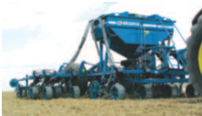
Rys. 1. Ośmiobelkowy agregat uprawowy Exaktgrubber - VARIO prod. Köckerling GmbH & Co. KG, Niemcy Fig. 1. Exaktgrubber - VARIO eight-beam cultivation aggregate manufactured by Köckerling GmbH & Co. KG (Germany)

Kombajn zbożowy JOHN DEERE T 560i nagrodzony Złotym Medalem MTP, na największej europejskiej wystawie Agritechnica w Hanowerze, która odbyła się w listopadzie 2007 r., otrzymał srebrny medal za nowatorskie rozwiązanie systemu omłotu i separacji ziarna (rys. 2).