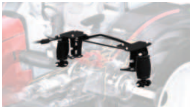
Rys. 12. Półaktywne zawieszenie kabiny AutoComfort prod. Valtra Inc. (Finlandia) Fig. 12. AutoComfort semi active cabin mounting manufactured by Valtra Inc. (Finland)

Półaktywne zawieszenie kabiny AutoComfort automatycznie dostosowuje się do różnych warunków pracy za sprawą elektronicznie sterowanych pochłaniaczy drgań, czujnika położenia i podzespołu sterującego, podłączonego do układu elektrycznego ciągnika poprzez magistralę CAN. Układ może regulować sztywność pochłaniania drgań co 2 ms w zależności od informacji o wykonanym ruchu, pochodzących z czujnika położenia i informacji o warunkach jazdy z magistrali CAN. Przykładowo, jeżeli CAN informuje o hamowaniu lub zmianie kierunku jazdy, to pozwala to na reakcję w postaci ograniczenia ruchów kabiny (rys. 12).