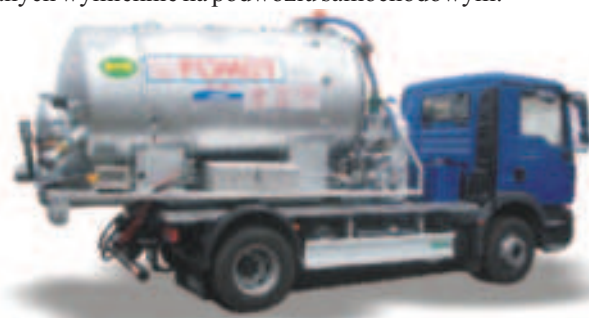
Rys. 3. Kontenerowe urządzenie asenizacyjno-czyszczące do instalacji ściekowych i kanalizacyjnych KA 4500K produkcji P.U.P. POMOT Spółka z o.o. Chojna

Kontenerowe urządzenie asenizacyjno-czyszczące do instalacji ściekowych i kanalizacyjnych KA 4500K ma szerokie zastosowanie w rolnictwie i gospodarce komunalnej (rys. 3). Wynika to z modułowej konstrukcji zespołów montowanych wymiennie na podwoziu samochodowym.