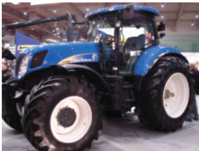
Rys. 9. Ciągnik rolniczy NEW HOLLAND T7050 prod. CNH International CNH UK Ltd, Wielka Brytania Fig. 9. NEW HOLLAND T7050 agricultural tractor manufactured by CNH International CNH UK Ltd (United Kingdom)

W ciągnikach NEW HOLLAND T7050 został zastosowany układ elektryczny CAN-BUS, który zmniejsza ilość przewodów o 20% w porównaniu z innymi konstrukcjami oraz