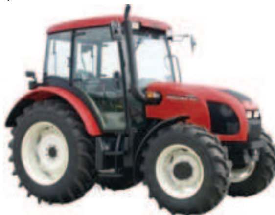
Rys. 5. Ciągnik rolniczy ZETOR 8441 PROXIMA prod. ZETOR TRACTORS A.S., Czechy Fig. 5. ZETOR 8441 PROXIMA agricultural tractor manufactured by ZETOR TRACTORS A.S. (Czech Republic)

do 150 litrów. Inną ważną zmianą konstrukcyjną jest przeniesienie akumulatora pod podłogę kabiny w prawej jej części. Poprawia to dostęp podczas jego obsługi oraz chroni przed silnymi wstrząsami. Wprowadzono ponadto szereg zmian technicznych mniej ważnych, ale poprawiających obsługę ciągnika, jego wykorzystanie oraz łatwiejszą obsługę przez osoby obsługujące. Przykładową zmianą to potwierdzającą jest przeniesienie rewersu mechanicznego na konsolę koła kierowniczego z lewej jej strony. Wszystkie ciągniki ZETOR z serii Proxima zostały zgodnie z dyrektywą Unii Europejskiej wyposażone w silniki spełniające normy emisji spalin EURO III (EEC III). Ponadto w ciągnikach tych obniżono poziom hałasu w kabinie o 3dB, co zdecydowanie poprawia warunki pracy operatora.