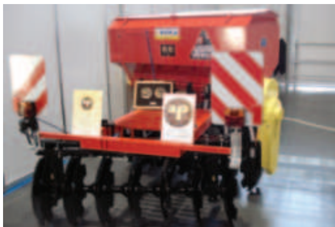
Rys. 13. Siewnik kukurydzy DZIK do zasiewu pasa przeciw-szkodowego przed zwierzyną leśną prod. ŁUCZAK Maszyny Rolnicze Stanisław Łuczak, Bartochów Fig. 13. DZIK maize seeder for periodical creating of green plant belt for forest game feeding and counteracting the damages in the main field crop manufactured by ŁUCZAK Maszyny Rolnicze Stanisław Łuczak, Bartochów (Poland)

Siewnik kukurydzy DZIK do zasiewu pasa przeciw-szkodowego przed zwierzyną leśną przeznaczony jest do wysiewu kukurydzy na tzw. pasy zaporowe, czyli łowieckie poletka żerowe i zgryzowe lokalizowane w lesie na drodze do pól lub upraw leśnych, mające na celu zatrzymanie zwierzyny i uniknięcie wyrządzanych przez nią szkód w uprawach rolnych (rys. 13).