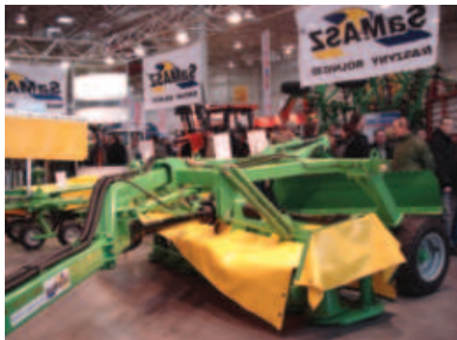
Rys. 6. Kosiarka tarczowa przyczepiana 3,4 m z walcami Heavy Duty i transporterem KDC 340 WP prod. SaMASZ inż. Antoni Stolarski, Białystok

Kosiarka tarczowa przyczepiana 3,4 m z walcami Heavy Duty i transporterem KDC 340 WP , wyposażona seryjnie w spulchniacz lub walec pokosu, przeznaczona jest do koszenia zielonek niskołodygowych na trwałych użytkach zielonych oraz na niezakamienionych polach uprawnych (rys. 6).