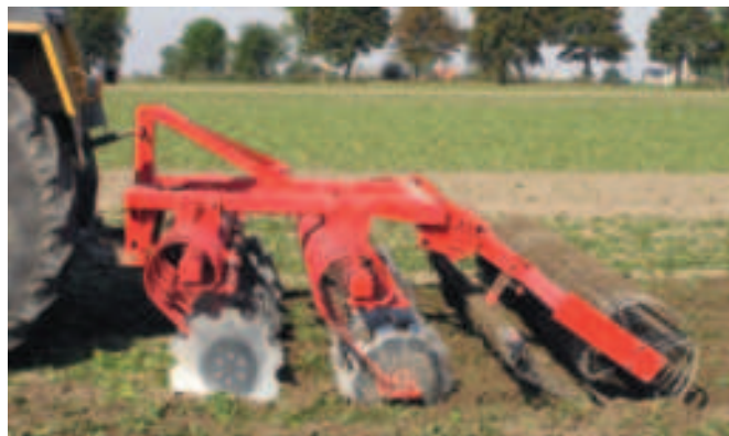
Rys. 14. Kompaktowa brona talerzowa serii KBT 30 R2 prod. BURY - Maszyny Rolnicze - Wojciech Bury, Kutno

Kąt natarcia jest regulowany, co wyróżnia maszynę spośród innych tego typu maszyn. Do KBT można stosować dwa rodzaje wałów: pierścieniowy i strunowy. Brona składana jest hydraulicznie.