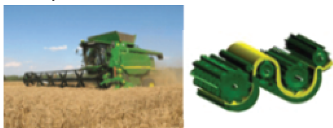
Rys. 2. Kombajn zbożowy JOHN DEERE T 560i prod. John Deere & Company, Niemcy Fig. 2. JOHN DEERE T 560i combine harvester manufactured by John Deere & Company (Germany)

Nowo opatentowany zespół omłotu i separacji ziarna eliminuje punkty załamań klepiska (rys. 2). Gwarantuje to wysoką jakość ziarna, bardzo niski udział uszkodzonych ziaren po omłocie, bardzo dobrą jakość słomy (duży udział długich frakcji słomy w masie poźniwej), niskie obciążenie mechanizmu czyszczącego ziarno, dzięki czemu jakość czyszczenia jest bardzo wysoka.