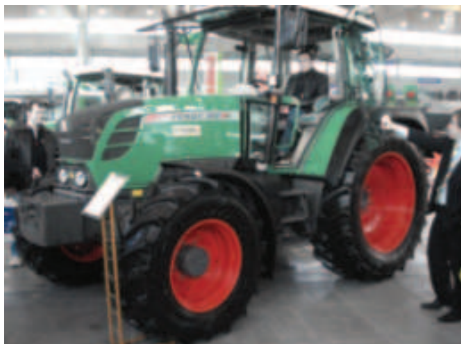
Rys. 11. Ciągnik rolniczy Fendt 312 Vario prod. AGCO GmbH Fig. 11. Fendt 312 Vario agricultural tractor manufactured by AGCO GmbH (Germany)

Półaktywne zawieszenie kabiny AutoComfort prod. Valtra Inc. (Finlandia), nagrodzone Złotym Medalem MTP, na wystawie Agritechnica w Hanowerze w listopadzie 2007 roku otrzymało srebrny medal.