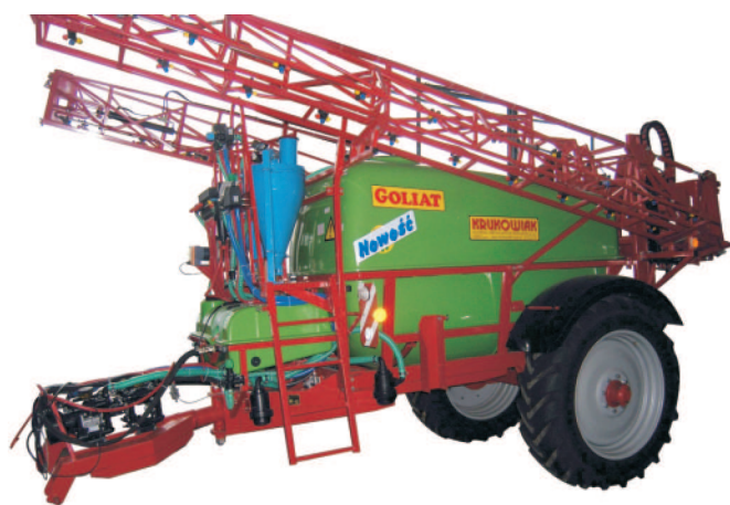
Rys. 5. Układ do wytwarzania cieczy roboczej zastosowano w opryskiwaczach do ochrony roślin produkcji Kujawskiej Fabryki Maszyn Rolniczych „KRUKOWIAK” Fig. 5. A System for Producing Working Liquid in Plant Protection Spraying Machines manufactured by KRUKOWIAK (Poland)

Złoty medal otrzymało też rozwiązanie „Układ do wytwarzania cieczy roboczej w opryskiwaczach do ochrony roślin” zgłoszone do ochrony patentowej w UP RP, jako wynalazek P 377977 (rys. 5). Twórcami wynalazku są: mgr inż. Bolesław Sobkowiak i mgr inż. Roman Rogacki z Przemysłowego Instytutu Maszyn Rolniczych w Poznaniu. Układ według wynalazku P 377977 został zastosowany w konstrukcji opryskiwacza opracowanego przez PIMR Poznań w ramach projektu celowego KBN nr 6T07 2004C/06342 dla Kujawskiej Fabryki Maszyn Rolniczych „KRUKOWIAK”.