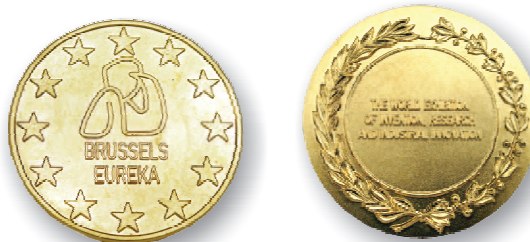
Rys. 4. Złoty Medal Międzynarodowych Targów Wynalazczości, Badań Naukowych i Nowych Technik BRUSSELS INNOVA 2008 Fig. 4. The Gold Medal of the 57th Edition of the World Exhibition on Innovation, Research and New Technologies