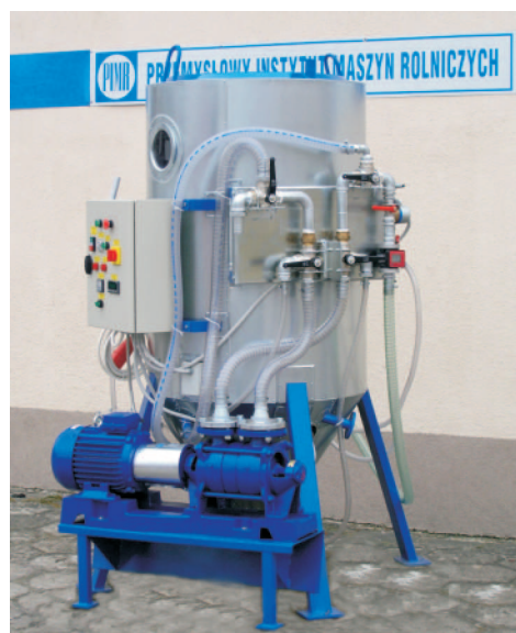
Rys. 3. Wytwórnia nowej generacji do produkcji paliwa odnawialnego z olejów roślinnych do napędu silników z zapłonem samoczynnym wykonana przez firmę PROMAR w Poznaniu Fig. 3. A new generation generator for manufacturing of renewable fuel from vegetable oils for self-ignition engines, manufactured by PROMAR Poznań (Poland)