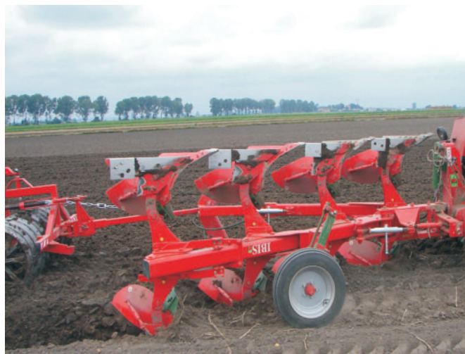
Rys. 4. Pług, w którym zastosowano lemiesz nagrodzony srebrnym medalem, wdrożony do produkcji w Zakładach METCHEM w Pilźnie

Fig. 6. A share for reversible and conventional tractor ploughs manufactured by new technology of cast components of agricultural machines, manufactured by METCHEM Pilzno (Poland)