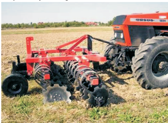
Rys. 2. Brona talerzowa może być zawieszona na przednim TUZ ciągnika

Na wyposażeniu brony znajdują się dodatkowe elementy układu zawieszenia, które umożliwiają zawieszenie samej brony talerzowej również na przednim TUZ ciągnika (rys. 2). Są one przykręcane na tylnej belce ramy, przy czym stojak podpierany jest odwróconymi zastrzałami stałego układu zawieszenia. Tak stosowana brona może być również wyposażona w dwa koła kopiujące, które mocowane są w dolnych zaczepach stałego układu zawieszenia.