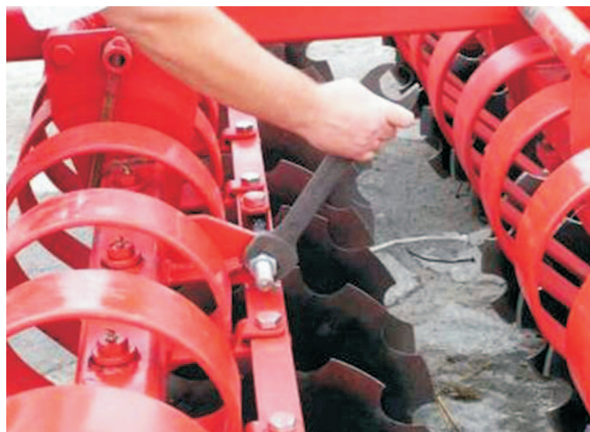
Rys. 5. Regulacja kąta natarcia talerzy

W bronie z regulacją kąta natarcia talerzy (rys. 5) można stosować różne ustawienia poszczególnych sekcji. W większości warunków korzystne jest ustawienie talerzy pierwszej sekcji pod kątem mniejszym np. 15°, co zmniejsza opory robocze, a talerzy sekcji drugiej pod kątem 20-25°, co poprawia mieszanie ścierniska z glebą. Po każdej zmianie kąta natarcia talerzy należy skorygować ustawienie poprzeczne sekcji, aby zachowana była podziałka pomiędzy talerzami pierwszej i drugiej sekcji.