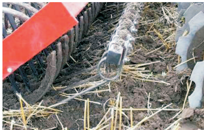
Rys. 7. Zgrzebło wrzuca resztki poźniwne pod wał

Gleba odrzucona przez drugą sekcję talerzy do tyłu uderza w zgrzebło ulegając dodatkowemu pokruszeniu. Sprężyste palce zgrzebła nawet przy bardzo niewielkim zagłębieniu dobrze rozrabiają powierzchniowe nierówności i wrzucają ściernisko bezpośrednio pod wał, który wciska je w glebę i ściąga z palców długie resztki (rys. 7).