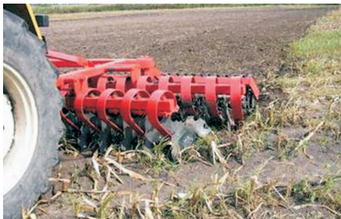
Rys. 6. Talerze o dużym kącie natarcia dobrze podcinają ściernisko po kukurydzy

Talerze są odporne na zapchania zarówno podczas podorywki ściernisk po zbożach, jak i trudnych do uprawy ściernisk po kukurydzy. Dobrze rozcinają słomę i resztki grubych łodyg kukurydzy umożliwiając tym samym lepsze ich wymieszanie z glebą (rys. 6). Dla pełnego podcięcia silnie ukorzonego ścierniska po kukurydzy korzystny jest większy kąt natarcia (20-25°), jaki można uzyskać w bronach z regulacją, a kierunek pracy powinien być skośny do rzędów.