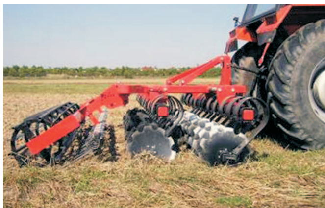
Rys. 1. Brona talerzowa z wałem strunowym podczas uprawy ścierniska

Plugi podorywkowe, zbyt głęboko i nierównomiernie przyorujące resztki poźniwe, zostały zastąpione mniej energochłonnymi i wydajniejszymi kultywatorami, które nie przykrywają, lecz mieszają ściernisko z glebą. W ostatnich latach wzrasta zainteresowanie rolników bronami talerzowymi. W porównaniu do kultywatorów są one odporniejsze na zapchania, umożliwiają wykonanie płytszej uprawy i lepiej mieszają ściernisko z glebą. Talerze rozcinają resztki poźniwe, ale niestety także rozłogi perzu i słabiej niszczą głęboko zakorzenione chwasty, jednakże na glebach utrzymanych w kulturze nie ma przeszkód w ich stosowaniu.