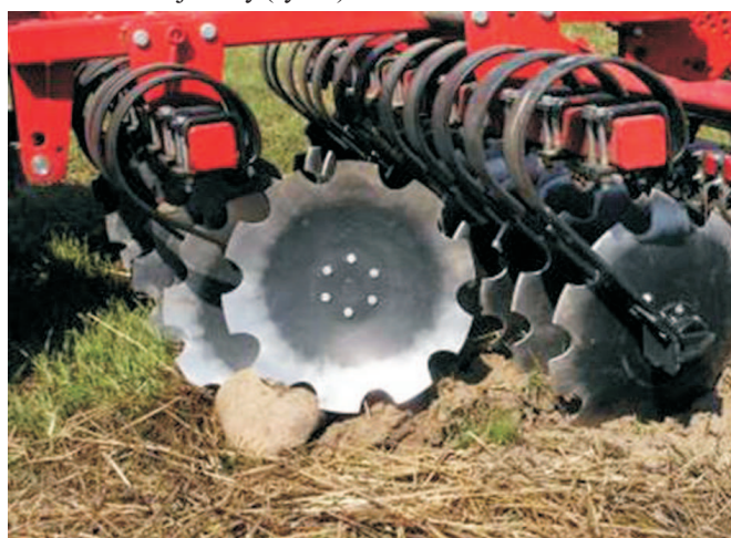
Rys. 4. Talerz unosi się na kamieniu

pozostawiają poszarpane, nierówne dno, zapobiegające tworzeniu się zwięzłej podeszwy w czasie suszy. Minimalna głębokość robocza zapewniająca pełne podcięcie ścierniska, wynosi 6 cm, a maksymalne zagłębienie talerzy może dochodzić na glebach lekkich i średnich do 13 cm, ale aby uzyskać pełne podcięcie gleby talerze drugiej sekcji powinny być ustawione dokładnie pomiędzy śladami pracy talerzy sekcji pierwszej. Skrajna bruzda z prawej strony jest zasypywana przez skrajny talerz drugiej sekcji, a w celu wyeliminowania bruzdy z lewej strony stosowany jest skrajny talerz o mniejszej średnicy. Odchylenie talerzy górną krawędzią do tyłu ułatwia ich zagłębianie się i zwiększa odrzucanie, a tym samym mieszanie gleby. Korzystny wpływ na utrzymywanie stałego zagłębienia i dostosowywanie się do nierówności terenu ma zamocowanie talerzy na sprężynach. Drgania sprężyn powodują swoisty efekt uderowy wspomagający zagłębianie, kruszenie gleby i samoczyszczanie się talerzy. Po natrafieniu na kamień talerz unosi się, a po ominięciu przeszkody ponownie zagłębia, nie powodując unoszenia całej brony (rys. 4).