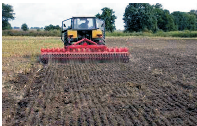
Rys. 8. Wał pierścieniowy pozostawia na powierzchni pola rowki

Ostatecznie po uprawie broną talerzową z wałem i zgrzebłem ściernisko jest w pełni podcięte i bardzo dobrze wymieszane w całej warstwie spulchnionej gleby. Na powierzchni, zależnie od wysokości ścierniska i głębokości uprawy, pozostaje tylko od 5 do 30% resztek. Taka uprawa spełnia wymagania podorywki oraz stwarza możliwości wykorzystania brony również do przedsięwzięcia doprawiania gleby, szczególnie w uprawie bezorkowej, gdy resztki poźniwne zalegają w warstwie siewnej.