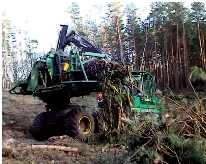
Rys. 4. Rozpadający się w trakcie odcinania pakiet gałęzi sosnowych

Pakieciarka formowała pakiety z gałęzi sosnowych odciętych od drzew 130-letnich. Były one stosunkowo grube i o znacznej długości. Pakietowanie takiego materiału roślinnego jest znacznie trudniejsze niż gałęzi świerkowych, do których maszyna jest przede wszystkim dostosowana. Zdarzały się przypadki, że pakiety rozpadały się w trakcie odcinania (rys. 4), wynikało to z przytoczonych wcześniej właściwości gałęzi sosnowych. Jest to także przyczyną konieczności wykonywania dodatkowych regulacji, których celem jest poprawianie jakości pracy na zrębach sosnowych.