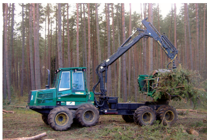
Rys. 1. Pakieciarka Timberjack 1410D podczas pracy

Ocenić poddane zostały parametry eksploatacyjne maszyny obliczone na podstawie realizacji procesu pakietowania na konkretnej, losowo wybranej powierzchni pozrębowej. Nie były obliczane i oceniane wskaźniki eksploatacyjne wynikające z rocznego rozmiaru i rozmieszczenia zadań. Podstawowe parametry techniczne badanej maszyny pakietującej Timberjack 1410D (rys. 1) zostały zamieszczone w opracowaniu Gendka i Zychowicza [2].