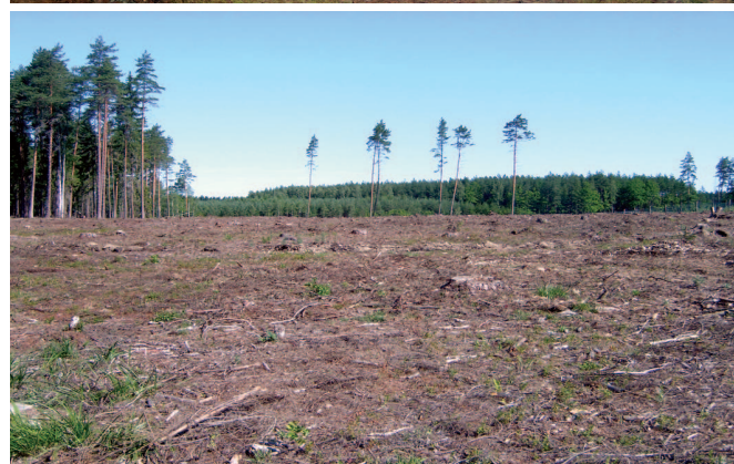
Rys. 5. Porównanie powierzchni pozrębowej przed i po pakietowaniu