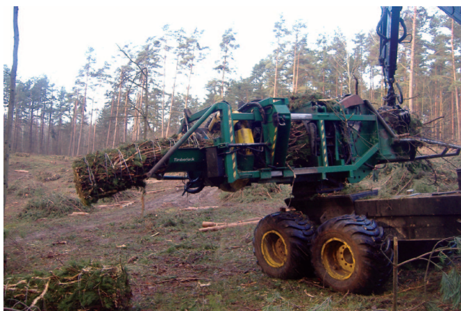
Rys. 2. Końcowa faza pakietowania, tuż przed odcięciem pakietu

Na rys. 2 przedstawiono moment zakończenia pakietowania, tuż przed przystąpieniem do odcinania pakietu.