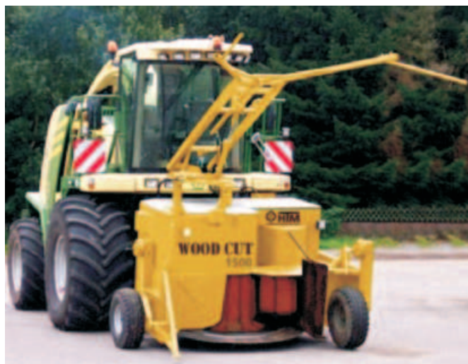
Rys. 3. Sieczkarnia samojezdna Krone Big X z przystawką Wood Cut 1500 [8] Fig. 3. The self-propelled chaff-cutter Krone Big X with cutting attachment Wood Cut 1500 [8]

Firma Krone do swoich standardowych sieczkarni Big X oferuje przystawkę WoodCut 1500 opracowaną we współpracy z niemieckimi firmami Hüttmann i HTM Häckseltechnik zajmującymi się produkcją maszyn do zbioru i przetwarzania dendromasy (rys. 3). Seria ta dysponuje mocą od 375-750 kW. Bębny sieczkarni ma szerokość 800 mm i średnicę 660 mm. Seryjnie wyposażony jest on w 20 noży ułożonych w układzie V, ale opcjonalnie istnieje możliwość zwiększenia ich do 28 lub nawet 40 [8].