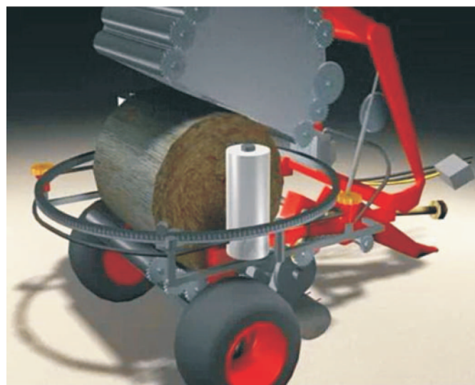
Rys. 3. Owijanie beli za pomocą dwóch aparatów z rolkami poruszającymi się po pierścieniu okrążającym belę