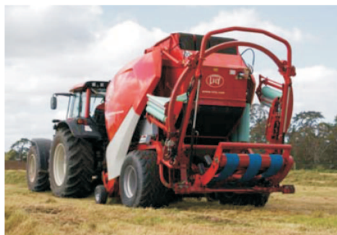
Rys. 5. Holenderska prasoowijarka Lely Welger RPC 445 Tornado z tylnym pierścieniem owijającym Fig. 5. Dutch Lely Welger RPC 445 Tornado integrated baler wrapper with the ring wrapper

W prasoowijarce Lely istotnymi czynnikami wpływającymi na automatyczne sterowanie procesem owijania jest średnica beli oraz wymagana ilość warstw folii. W związku z tym średnica beli mierzona jest już w momencie owijania jej siatką, gdzie dalej przekazywana jest do systemu owijającego, który natychmiast ustala właściwą wysokość położenia pierścienia znajdującej się z tyłu prasoowijarki. Następnie komputer oblicza liczbę obrotów, które są niezbędne do wymaganej liczby warstw. Ponadto producent zapewnia, iż użyty system CPS pozwala utrzymać wysoki stopień zgniotu beli