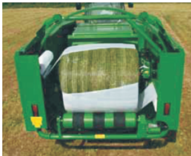
Rys. 4. Pionowy pierścień owijający belę w prasoowijarce McHale

Irlandzka maszyna McHale jest prasoowijarką, w której komora beli dzieli się poziomo, gdzie dolna część przenosi belę w kierunku pionowego pierścienia, który następnie ją owija. Według producenta jest to wyjątkową zaletą. Ponieważ dolna połowa komory zawiera mechanizm przenoszenia, eliminuje to potrzebę stosowania obrotowego stołu bądź też ramion owijających pomiędzy prasą a owijarką. W wyniku tego zmniejsza się pole pracy całej maszyny, gdzie całkowita jej długość wynosi 5,8 metra. Czyni to ją bardziej zwartą i skraca czas przekazywania beli do tyłu. Bala przekazywana jest bezpośrednio w kierunku owijarki za pomocą pięciu rolek dolnej sekcji komory zwijania. Na terenach pagórkowatych gwarancję prawidłowej pracy umożliwiała dodatkowa rolka umieszczona na zewnątrz komory zwijającej. Kiedy prasoowijarka pracuje na zboczu wzgórze, może zaistnieć problem niekontrolowanego zsunięcia się beli. Jest to jednak wykluczone, gdyż ścianki boczne komory zwijającej zabezpieczają belę przed przesunięciem się [3].