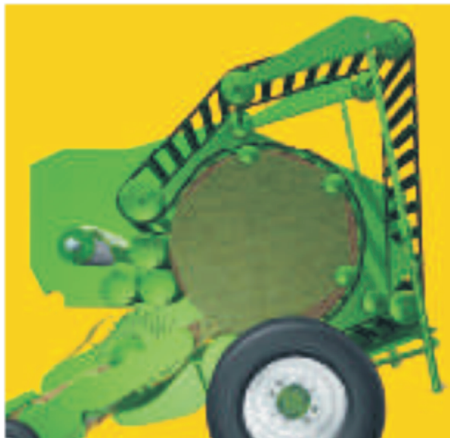
Rys. 1. Zwijanie materiału za pomocą pasa listwowego Fig. 1. Material scrolling by the slat belt

Nierówny zbiór pokosu i zablokowanie pracy maszyny, znane są każdemu rolnikowi. Aby zapobiec tym problemom, firma Krone zadbała, by materiał był transportowany i rozdzielany w sposób ciągły przez rząd noży. Noże te są zabezpieczone przed ciałami obcymi, a szczytowe obciążenia w czasie ich pracy zostają zlikwidowane, ponieważ cięcie następuje „po kolei”. Ponadto istnieje możliwość hydraulicznego ich ustawiania w położeniu 0 oraz montażu i demontażu bez użycia narzędzi [3].