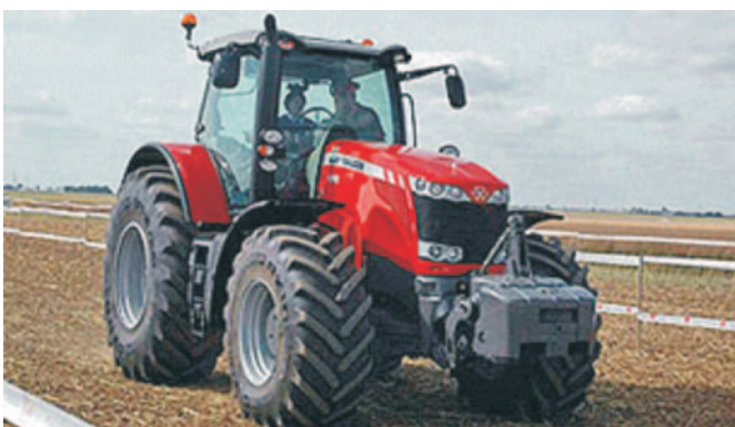
14/ Ciągnik rolniczy MASSEY FERGUSON MF 8690 - Producent: AGCO S.A.

Ciągnik jako pierwszy na świecie wyposażony został w innowacyjny system selektywnej redukcji katalitycznej spalin SCR e3. Dzięki temu systemowi jest on najczystszym ciągnikiem pod względem emisji spalin i bardzo oszczędnym w zużyciu paliwa. Model 8690 jest wyposażony w przekładnię bezstopniową DynaVT, układ SCR, 6-cylindrowy silnik Sisu Diesel o mocy znamionowej 340 KM.