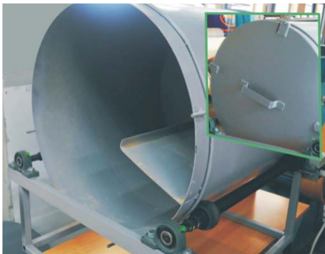
Rys. 2. Stanowisko do badania współczynnika trwałości brykietów

m_A - masa brykietu po przeprowadzonej próbie [g].