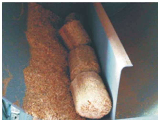
Rys. 3. Brykiety w bębnie stanowiska pomiarowego Fig. 3. Briquettes in the tester