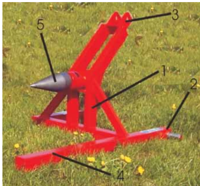
Rys. 3. Łuparka stożkowa: 1 - rama, 2 - sworznie do mocowania cięgien podnośnika, 3 - łącznik górnego podnośnika, 4 - zabezpieczenie, 5 - głowica stożkowa Fig. 3. Conical splitting machine: 1 - frame, 2 - the pins to attach lift tendons, 3 - upper connector of elevator, 4 - safeguard, 5 - conical head

Zespoły śrubowe (rys. 3) pracują poprzecznie do osi kłody przez wstępne boczne wwiercenie się gwintowanego stożka i dalsze rozdzielanie kłody klinem stożkowym. Maszyny te spotykane są coraz rzadziej i zastępowane są łuparkami klinowymi, które charakteryzują się większym bezpieczeństwem i wydajnością pracy oraz zakresem siły rozłupywania.