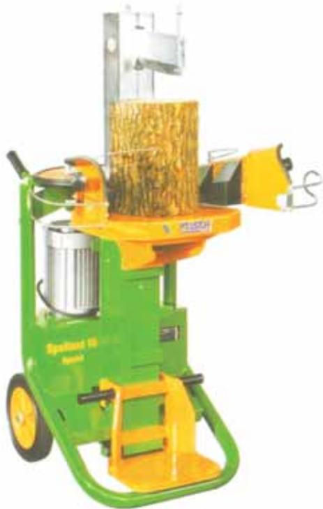
Rys. 2. Łuparka z pojedynczym klinem Fig. 2. Splitting machine with a single wedge

Łuparki można podzielić na klinowe i śrubowe. Podział ten uwzględnia różnice w zespołach rozłupujących maszyn. Działanie zespołu klinowego opiera się na pracy pojedynczego (rys. 2) lub złożonego klina rozłupującego kłodę wzdłuż.