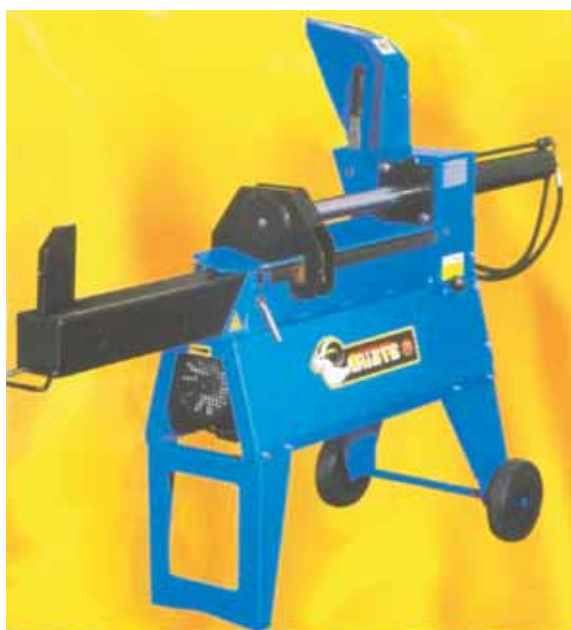
Rys. 7. Łuparka klinowa pozioma