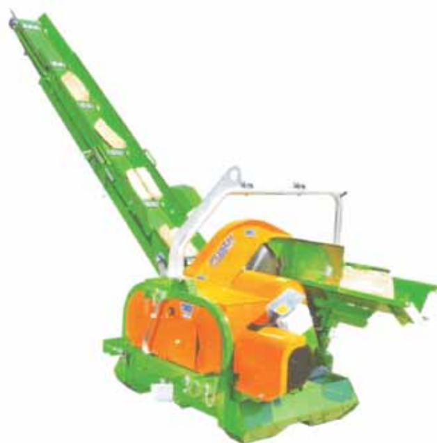
Rys. 5. Piło-łuparka Fig. 5. Sawing-Splitting machine