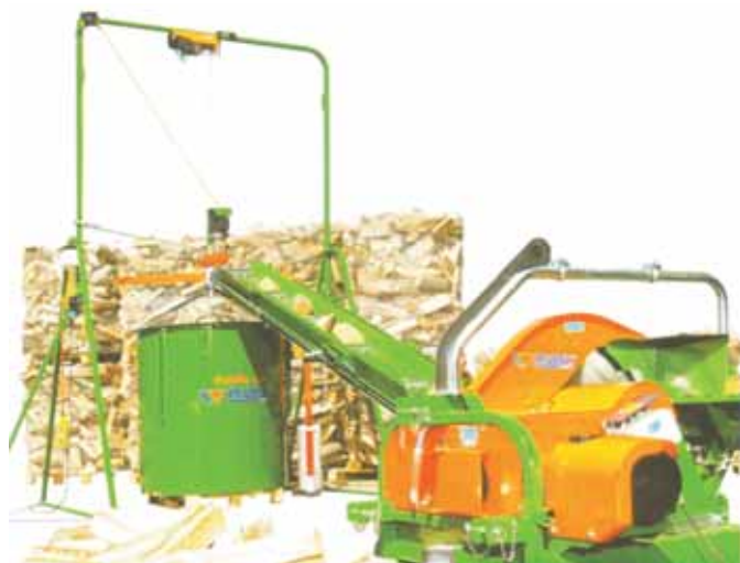
Rys. 6. Zestaw maszynowy do produkcji opakowanego drewna kominkowego

Ze względu na sposób przemieszczania łuparki można podzielić na: wózkowe, przyczepiane, zawieszane lub stacjonarne. Mogą występować jako maszyny samodzielne, piło-łuparki (rys. 5) lub jako automaty do przygotowania często już opakowanego drewna kominkowego (rys. 6).