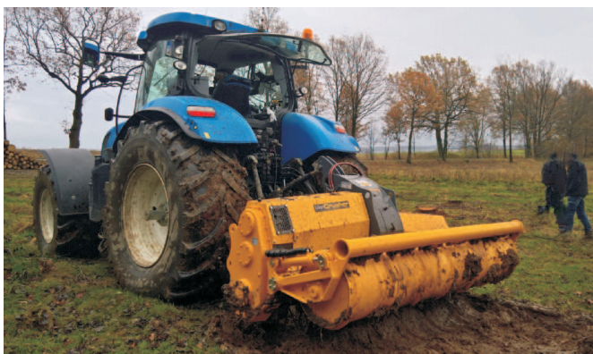
Rys. 2. Rozdrabniarka MJS-241 STG z ciągnikiem New Holland T.7.260