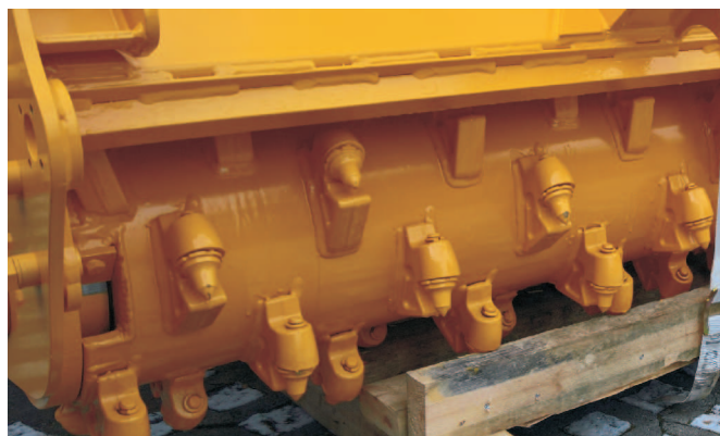
Rys. 1. Ząb tnący w osadzie na bębnie roboczym rozdrabniarki MJS-241 STG

wierzchołkowej, stąd ich trwałość zależy od ilości rozdrobnionych pozostałości zrębowych oraz obecnych w glebie kamieni i pniaków. Umieszczona za wirnikiem roboczym sterowana hydraulicznie płyta oraz bęben ugniatający nie pozwalają na wyrzucanie rozdrobnionego materiału (gleby, kamieni, kawałków drewna). Bęben ugniatający służy również do regulacji głębokości pracy. Charakterystykę badanego modelu rozdrabniarki przedstawiono w tab. 1. Należy dodać, że rozdrabniarka jest najczęściej konfigurowana do pracy w trybie współbieżnym przy poruszaniu się ciągnika do przodu.