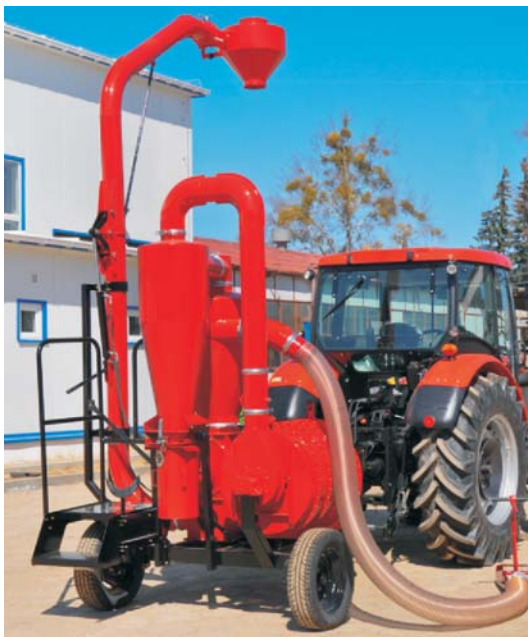
Rys. 1. Widok ogólny pięciostopniowego przenośnika pneumatycznego

Przeprowadzono badania drgań mechanicznych innowacyjnego pięciostopniowego przenośnika pneumatycznego ssąco-tłoczącego [6]. Badany przenośnik przedstawiono na rys. 1.