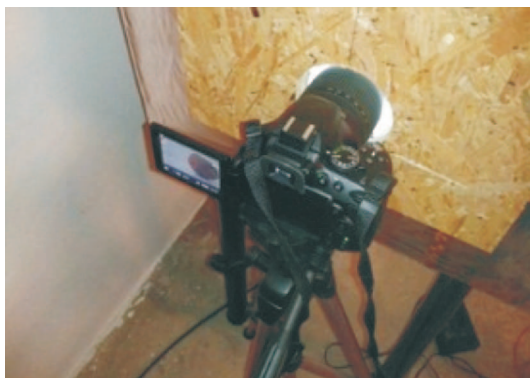
Rys. 3. Aparatura do akwizycji obrazu Fig. 3. The equipment for image acquisition