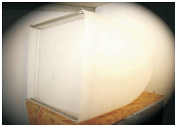
Rys. 1. Namiot bezcieniowy w akwizycji obrazu Fig. 1. The tent of shadow-free in image acquisition

Innowacją tej komory bezcieniowej jest automatyzacja wykonania dużej liczby obiektów graficznych z wykorzystaniem modułu sterującego. Silnik modułu sterującego może pracować w trzech trybach: synchronicznym, asynchronicznym oraz cyklicznym. W celu zapewnienia powtarzalności wykonywanych zdjęć zastosowano tryb cykliczny pracy silnika. Talerz obrotowy umocowany wewnątrz komory jest obracany za pomocą silnika krokowego [5]. Liczba obrotów na cykl w tym przypadku wynosi 50, tzn. silnik wykona obrót o 90 stopni.