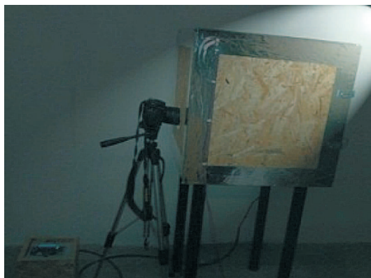
Rys. 4. Elementy stanowiska do akwizycji obrazu Fig. 4. Elements of research station for image acquisition