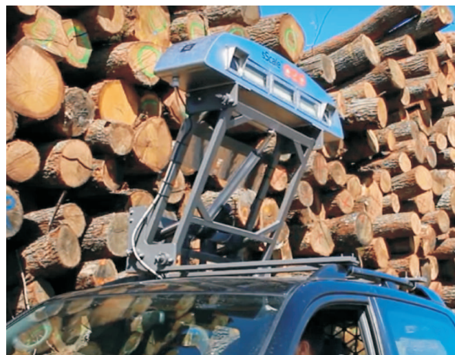
Rys. 3. Monitorowanie postępu prac Fig. 3. Monitoring of work progress