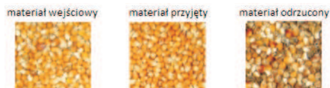
Rys. 2. Efekt pracy maszyny SORTEX Z+ Vx firmy Bühler na przykładzie kukurydzy żółtej [11] Fig. 2. Effect of work of Bühler's SORTEX Z+ Vx machine on the example of yellow corn [11]

Na podstawie danych impulsu przekazanego przez kamery wyrzutnik dokonuje separacji materiału na produkty spełniające wymaganą jakość oraz na produkty jakości tej nie spełniające. Na rys. 2 przedstawiono zdjęcia nasion kukurydzy przed i po separacji, której dokonano z wykorzystaniem sortownika optycznego [6, 11].