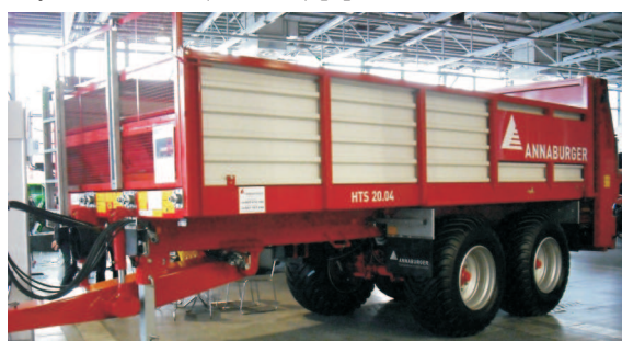
Rys. 2. Rozrzutnik obornika HTS 20.04 firmy Annaburger [4] Fig. 2. HTS 20.04 muck spreader manufactured by Annaburger [4]

Firma Annaburger zaprezentowała dwuosioowy rozrzutnik obornika HTS 20.04 o objętości użytkowej 17 m 3 (rys. 2). Charakteryzuje się on jednolitą spawaną konstrukcją ramy i skrzyni. Profilowane ściany z blachy Ekotal zapewniają wytrzymałość i niską masę własną w stosunku do objętości skrzyni. Zespół roboczy składa się z dwóch poziomych bębnow ze ślimakowymi zębatymi zwojami rozprowadzającymi rozdroniony materiał na dwie tarcze z sześcioma łopatkami, zapewniającymi szerokość roboczą rozrzutu do 24 m. Opcjonalnie może być zastosowany komputer AMS 5 sterujący wszystkimi funkcjami hydraulicznymi, który zawiera automatyczny hamulec Auto Stop zapobiegający uszkodzeniu maszyny. Rozrzutnik może być opcjonalnie połączony z systemem ISOBUS i Precision Farming. Maszyna może być wyposażona w układ osi tandem BPW z osiami wahliwymi, boogie lub amortyzowana hydraulicznie. Zapotrzebowanie na moc wynosi 103 kW (140 KM) [3].