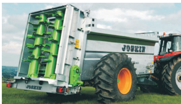
Rys. 7. Rozrzutnik obornika Siroko S4010/9V firmy Joskin [3] Fig. 7. Siroko S4010/9V muck spreader manufactured by Joskin [3]

o średnicy 829 mm z samochowującymi się łopatkami. Na podłodze umieszczony jest przenośnik łańcuchowy. Istnieje możliwość regulacji przepływu materiału. Tylna ściana gilotynowa, po zdjęciu adaptera umożliwia wykorzystanie maszyny jako środka transportu. W zależności od rodzaju materiału szerokość rozrzutu wynosi od 7 do 10 m [3].