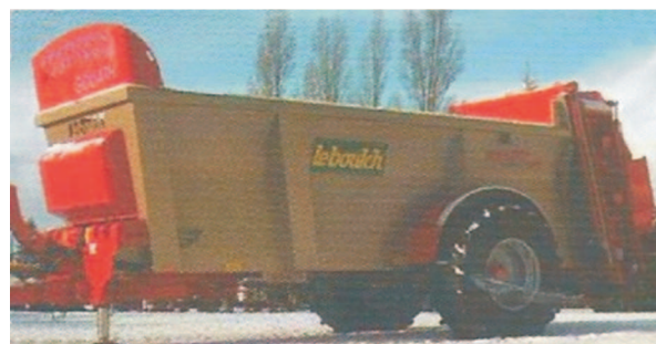
Rys. 6. Rozrzutnik obornika Goliath 62S19 firmy Leboulch [3] Fig. 6. Goliath 62S19 muck spreader manufactured by Leboulch [3]

Jednoosiowy rozrzutnik obornika francuskiej firmy Leboulch (rys. 6) ma pojemność skrzyni 19 m 3 . Tylna ściana jest zamykana zasuwą gilotynową z zabezpieczeniem elektrycznym i mechanicznym wskaźnikiem podniesienia zasuwy. Zespół roboczy składa się z dwóch pionowych bębnow z wymiennymi, obracalnymi łopatkami. Ekran kontrolny umożliwia monitorowanie rozrzutu obornika. Przenośnik podłogowy dwułańcuchowy z ogniwami Vaucanson, charakteryzującymi się niezawodnością i odpornością na zużycie. Aby uzyskać wymaganą dawkę obornika na hektar, prędkość posuwu przenośnika jest regulowana automatycznie w zależności od szerokości roboczej, gęstości rozrzucanego materiału i ustawienia ściany tylnej [3].