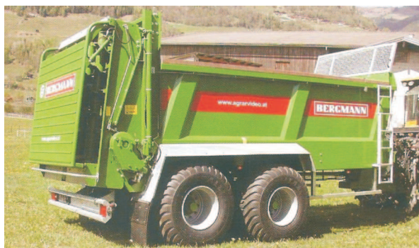
Rys. 3. Rozrzutnik obornika TSW 4190 S firmy Bergmann [3] Fig. 3. TSW 4190 muck spreader manufactured by Bergmann [3]

Rozrzutnik obornika TWS 4190 S firmy Bergmann (rys. 3) o pojemności skrzyni 14 m 3 jest jednym z pięciu rozrzutników tej serii o układzie osi tandem. Konstrukcja ramy jest kompaktowa. Dolny i górny zaczep, ściany boczne oraz wręgi są ze sobą zespawane. Skrzynia w postaci rozbieżnej stalowej wanny pozwala na przewożenie i rozrzucanie materiałów o konsystencji półpłynnej, a także pomiotu kurzego i wapna. Zespół roboczy składa się z dwóch poziomych bębnow o szerokości 1,4 m rozdrabniających obornik, i tylnej kłapy wyłożonej tworzywem w celu amortyzacji uderzeń rozdrabnianego obornika.