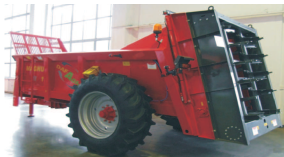
Rys. 5. Rozrzutnik obornika MAGNUM III 10 firmy DAFAGRO [4] Fig. 5. MAGNUM III 10 muck spreader manufactured by DAFAGRO [4]

Firma DAFAGRO zaprezentowała jednoosiowy rozrzutnik obornika MAGNUM III 10 (rys. 5) o pojemności 12 m 3 z dwurzędowym przenośnikiem podłogowym. Demontowany zespół roboczy składa się z adaptera o dwóch bębnow pionowych. Szerokość rozrzutu obornika wynosi 12-15 m, a rozrzutu wapna i nawozów w pasie o szerokości 6-7 m. Możliwe jest powiększanie objętości skrzyni za pomocą nadstawek. Zapotrzebowanie na moc wynosi 73 kW (100 KM) [3].