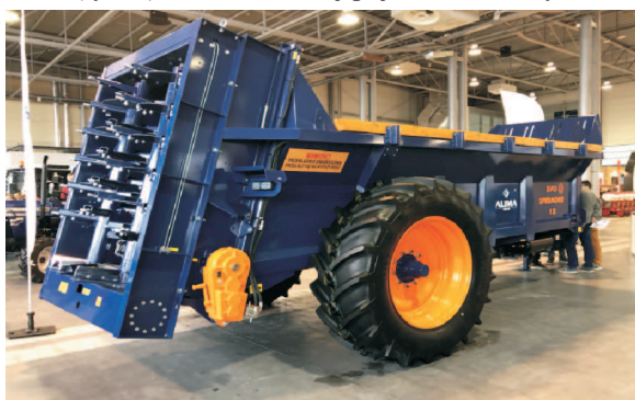
Rys. 1. Rozrzutnik obornika Evo Spreader firmy Alima Bis [3] Fig. 1. Evo Spreader manufactured by Alima Bis [3]

Firma Alima Bis zaprezentowała na targach rozrzutnik Evo Spreader (rys. 1) o standardowej pojemności skrzyni 14,8 m 3 ,