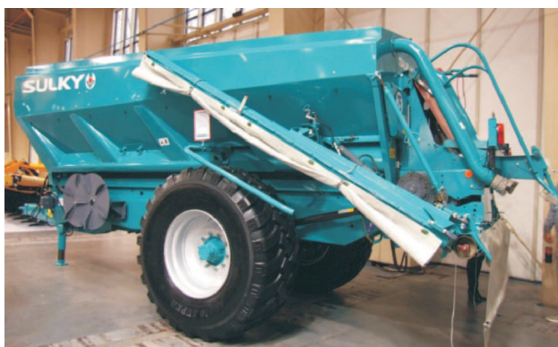
Rys. 12. Rozsiewacz nawozów XT 160 firmy Sulky [4] Fig. 12. XT 160 fertilizer spreader manufactured by Sulky [4]

Zestaw rozsiewający Epsilon System do rozsiewu nawozów granulowanych składa się z dwóch tarcz z dwoma parami łopatek o różnej długości w celu pełnego pokrycia powierzchni rozsiewu. Natomiast do nawozów luzem, wapna nawozowego lub pelletu stosowane są tarcze z pięcioma łopatkami. Do wysiewu środków pylistych stosowana jest składana belka o szerokości 9 m. Maszyna jest wyposażona w dwie rury do pneumatycznego napełniania nawozami pylistymi ze środków transportowych oraz w plandekę przykrywającą zbiornik. W rozsiewaczu Sulky taśma podłogowa jest podniesiona w tylnej części o kąt 3°. Rozwiązanie to ułatwia przenoszenie materiału do tyłu skrzyni rozsiewacza, co zapobiega ubijaniu się produktu przy zasuwie. Ponadto inne rozłożenie masy zapewnia dociążenia tylnych kół ciągnika i zwiększenie przyczepności.