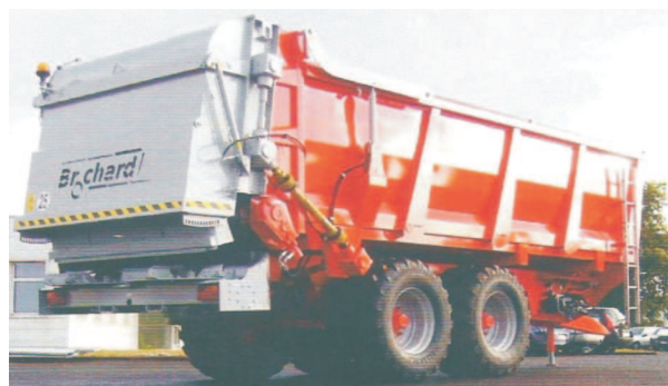
Rys. 4. Rozrzutnik obornika Dragon EV 2200 firmy Brochard [3] Fig. 4. Dragon EV 2200 muck spreader manufactured by Brochard [3]

Firma Brochard przedstawiła dwa rozrzutniki z serii Dragon EV 2200 o pojemnościach 21,45 m 3 (rys. 4) i 33 m 3 . Są to rozrzutniki dwu- i trzyosiowe z jedną lub dwiema osiami skrętnymi. Zespół roboczy składa się z dwóch pionowych bębnow i poziomego adaptera talerzowego z zabezpieczeniem bębnow przez automatyczne wyłączenie przenośników. W zależności od modelu przenośnik podłogowy jest jedno- lub dwurzędowy z ogniwami Vaucanson lub dwurzędowy z łańcuchami rubig. Rozrzutniki wyposażono w wagę z sześcioma sensorami, system sterowania GPS AG LEADER oraz system dawko-