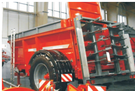
Rys. 9. Rozrzutnik obornika Apollo 13 Premium firmy UNIA [4] Fig. 9. Apollo 13 Premium muck spreader manufactured by UNIA [4]

Firma UNIA zaprezentowała rozrzutnik obornika Apollo 13 Premium (rys. 9) o pojemności zbiornika 12 m 3 i ładowności 10 t, który jest maszyną z typoszeregu tej serii od 6,5 do 18,0 t. Adapter składa się z dwóch bębnow pionowych i tarcz umożliwiających także rozrzut torfu i wapna. Dwurzędowy podłogowy przenośnik łańcuchowy napędzany jest hydraulicznie. Zapotrzebowanie na moc wynosi 59-88 kW (80-120 KM), co odpowiada możliwościom energetycznym małych i średnich gospodarstw. Po demontażu adaptera zasuwa tylna umożliwia wykorzystanie maszyny jako środka transportowego. Dyszel zawieszony na resorze piórowym tłumi wszelkie nierówności podczas pracy [3].