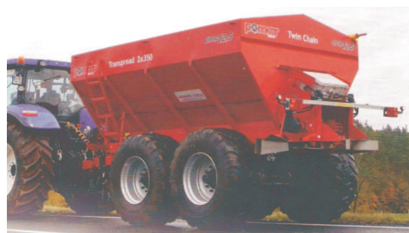
Rys. 10. Rozsiewacz nawozów Transpread 2x350 firmy POMOT [3] Fig. 10. Transpread 2x350 fertilizer spreader manufactured by POMOT [3]

Firma POMOT Chojna przedstawiła rozsiewacz nawozów Transpread 2x350 (rys. 10) z przenośnikiem łańcuchowym Twin Chain o szerokości 2x350 mm i systemem Spread Smart 1020p , który współpracując z systemem GPS steruje pracą maszyny. Zespół roboczy składa się z dwóch hydraulicznie napędzanych talerzy rozsiewających, z czterema łopatkami. Może on być wykorzystywany do rozsiewu nawozów mineralnych, wapna, pomiotu kurzego oraz kompostu.