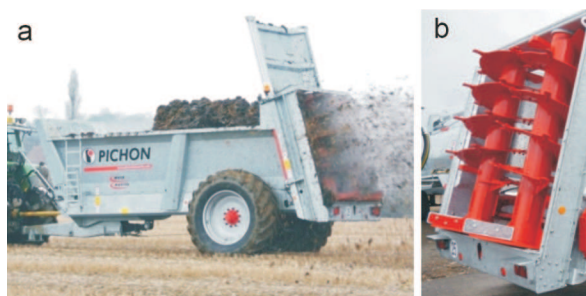
Rys. 8. Rozrzutnik obornika M1350 firmy Pichon - a), usytuowanie bębnow rozrzucających - b) [5] Fig. 8. M1350 muck spreader manufactured by Pichon - a), installing of spreading drums - b) [5]

Rozrzutnik obornika Muck Master M1350 firmy Pichon (rys. 8a) ma pojemność skrzyni 12,8 m 3 . Przez dodanie bocznych nadstawek jej pojemność może być zwiększona do 13,7 m 3 (symbol M1450); maszyna jest ocynkowana. Zastosowano w niej jeden łańcuchowy przenośnik podłogowy z ogniwami Vaucanson . Umieszczenie bębnow rozrzucających na samym końcu adaptera (rys. 8b) zapobiega przemieszczaniu się obornika z powrotem do wnętrza skrzyni. W tylnej części zbiornika znajduje się hydraulicznie podnoszona ściana, a w opcji mogą być zamontowane deflektory boczne. Zamontowany system proporcjonalnego dawkowania (DPA) umożliwia regulację rozrzucania obornika przez zmianę prędkości przenośnika podłogowego w zależności od szerokości roboczej i wysokości materiału znajdującego się w skrzyni. Maszyna jest kompatybilna z systemem ISOBUS. Zapotrzebowanie na moc wynosi 147 kW (200 KM) [3].