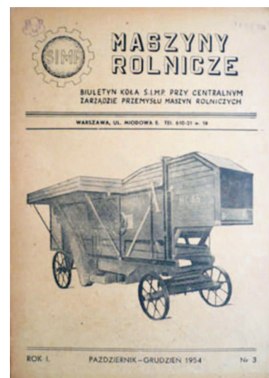
Okladka trzeciego numeru „Maszyn Rolniczych”