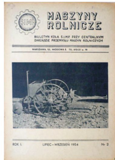
Okladka drugiego numeru „Maszyn Rolniczych”