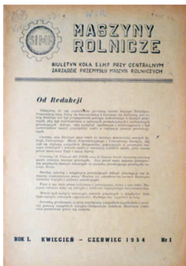
Okladka pierwszego numeru „Maszyn Rolniczych”