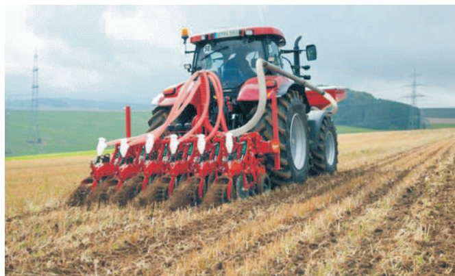
Fig. 2. Trimble automatic tractor control system