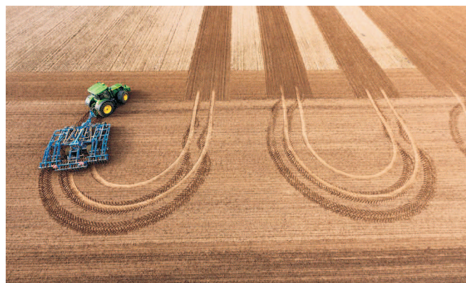
Fig. 4. Precise guidance of the tractor driving on the right track after loop turning